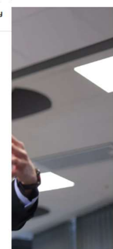
isjonen har i både